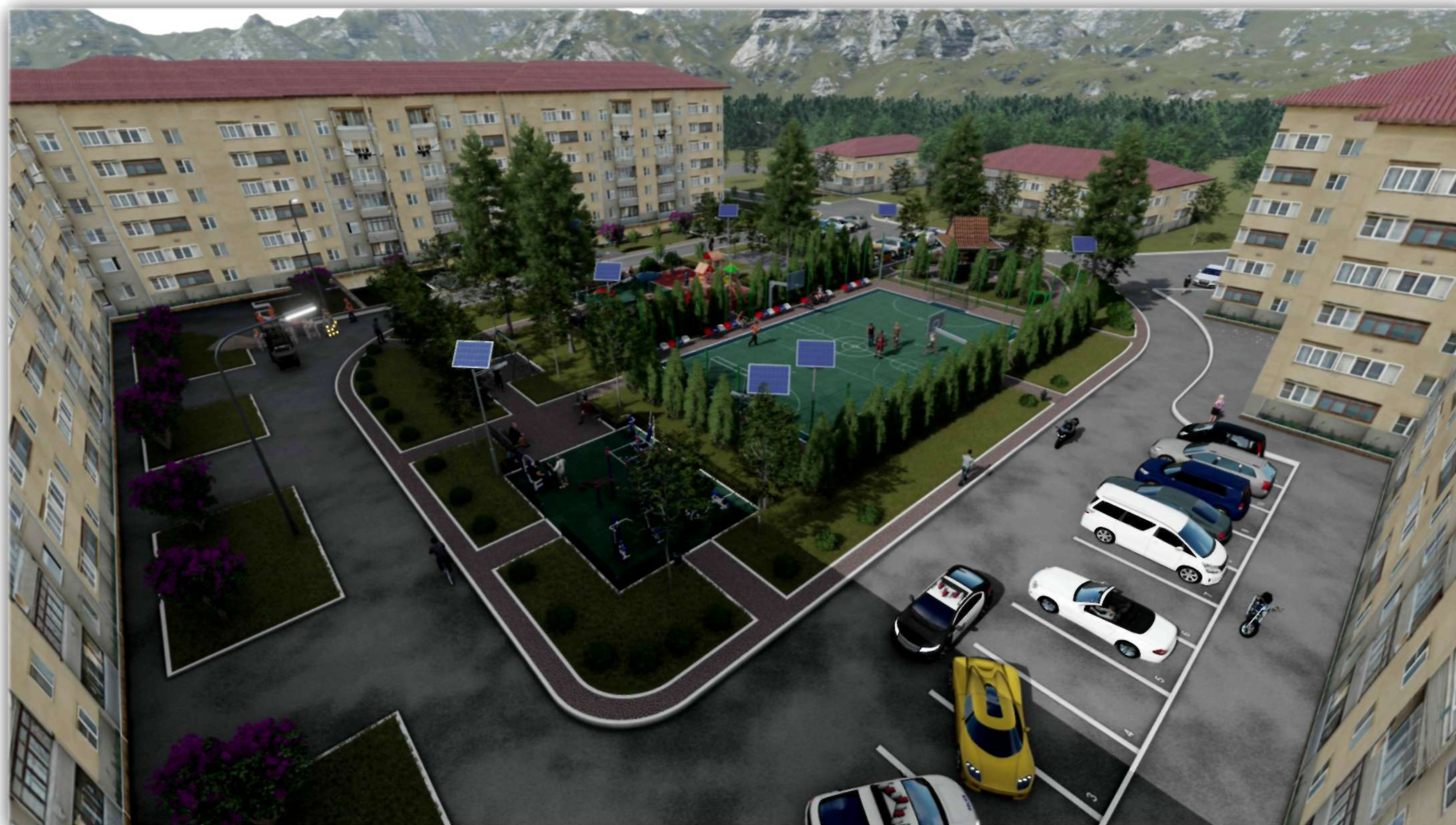
Фото от 13.08.19г.